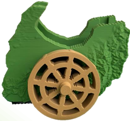
富山・立山連峰のジオラマをテープカッターに テープロールは海王丸の舵輪をモチーフ